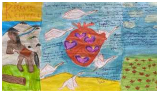
3-сурет. «Керқұла атты Кендебай» ертегісі негізінде жасалған эйдос-конспект