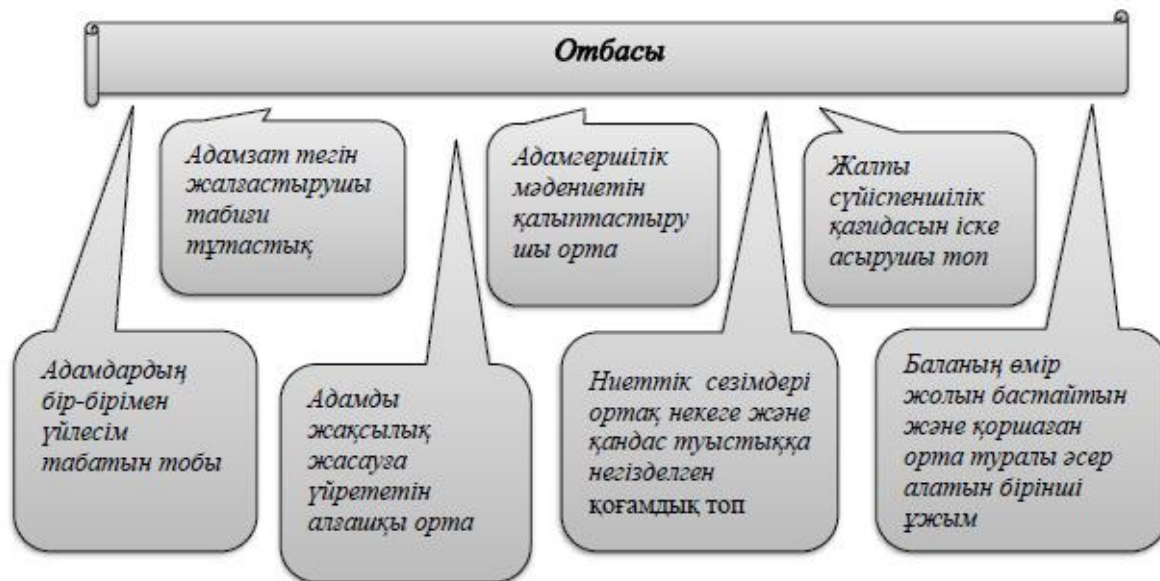
Сурет 2 Отбасы ұғымының құрылымы

Біз, әдіснамалық тұрғыдан отбасын әлеуметтік институт, кіші әлеуметтік топ, қоғамның әлеуметтік қауымдастық және экономикалық ұяшық формасы ретінде, сонымен қатар осылардың қайсысында дағдарыстың байқалатынын анықтаудың қажеттілігін көрсететіндігін негіздейміз. Біз, жоғарыда көптеген ғалымдардың «отбасы» түсінігіне берген тұжырымдарын негізге ала отырып, «отбасы» ұғымының құрылымын ұсынамыз (сурет 2).