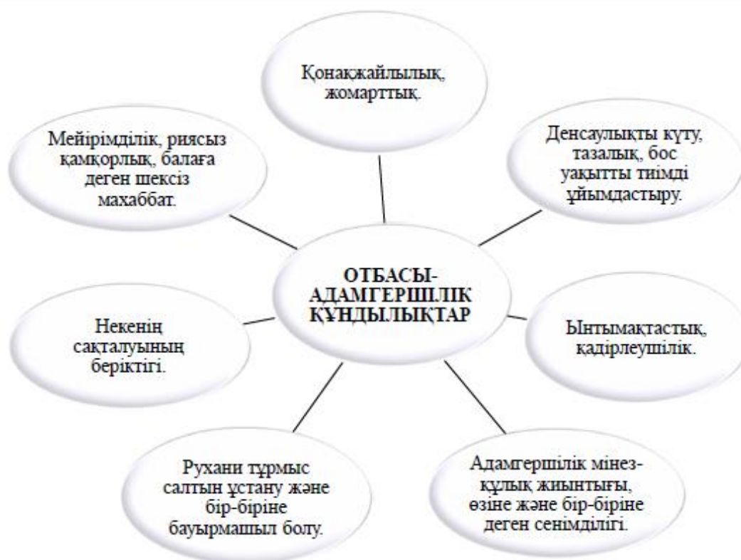
Сурет 3. Отбасы-адамгершілік құндылықтар құрылымы

Демек отбасы адамзаттың аса қажетті, әрі қасиетті алтын мектебі, адам үшін ең жақын әлеуметтік орта ретінде белгілі дәстүрлердің, жағымды өнегелердің, мұралар мен салт-дәстүрлер, отбасы-адамгершілік құндылықтардың сақтаушысы. Отбасы-адамгершілік құндылықтарды қалыптастыру, бұл құрамына отбасы институты, оның функциялары, кезеңдері жөніндегі білімді меңгеру енетін көпжақты үрдіс болып көрініс тапты.