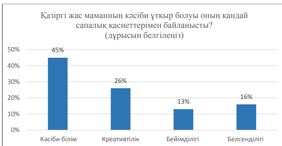
Сурет 2 – Студенттердің кәсіби ұтқырлықтың ішкі құрамалары туралы түсінік деңгейлерінің көрсеткіштері

Сауалнама нәтижесіне талдау жасап барысында студенттердің «кәсіби ұтқырлық» түсінігі мен оның құрамалары туралы ойлары шашыранқы екендігі анықталды, оған жоғарғыдағы көрсеткіштер дәлел бола алады. Алынған нәтижелер болашақ педагог-психологтардың «ұтқырлық», «кәсіби ұтқырлық» ұғымдарының мәнін түсініп және оның мазмұнындағы сапаларды олардың бойына дарыту үшін арнайы жұмыс жүргізу керек екендігін алға шығарады.