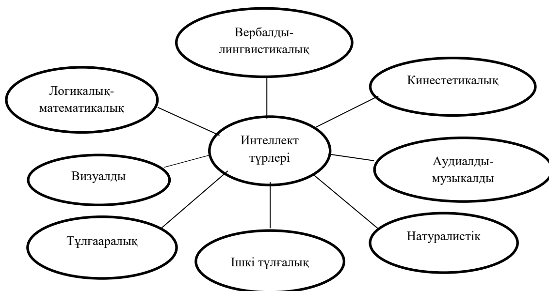
Сурет 1. Х.Гарднердің «Бірнеше интеллект теориясының» моделі.

Томлинсонның пікірінше оқушылардың профильдері өз бетінше жұмыс істейтін, топтармен жұмыс істейтін, логикалық жүйелілікті қалайтын, конспект арқылы үйренетін, тыңдап түсіну арқылы ақпаратты қабылдайтын, демонстрациялау немесе видео ақпарат арқылы жұмыс істейтін, музыкалық интеллекттілер сияқты түрлі ауыспалы аспектілерді қамтиды. Мұғалімдер осы ауыспалыларды ескере отырып, оқушылардың ерекшеліктеріне қарай және оқу стильдеріне сай қолайлы оқу жағдайларын (кооперативті оқыту, жекелеп оқыту, жарыса оқыту, мазмұнды модификациялап оқыту) жасайды [6].