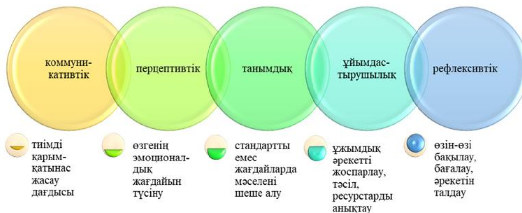
Сурет 1 - Әлеуметтік дағдылар тобы

Сонымен, ғылыми-педагогикалық еңбектердегі әлеуметтік дағдыны дамыту мәселесін зерттей келіп, «бастауыш сынып оқушыларының әлеуметтік дағдылары – олардың қоғамға ену, қарым-қатынас құру арқылы өзара бірлескен әрекет жасау іскерлігі» деген тұжырым жасаймыз және оның қамтитын дағдылар қатарын 1-суреттегідей ұсынамыз.