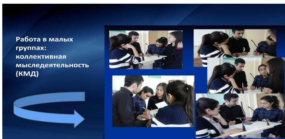
Фото 2. - Работа в малых группах: коллективная мыследеятельность на основе интеракции

Анализ специальной литературы и опыт нашей работы позволяют утвердиться и следующем: на сегодня одной из важнейших инновационных форм интерактивного обучения является работа в малых группах. Особенность интерактивного обучения в малых группах в том, что она представляет собой совместный процесс познания обучающихся через диалог (Коротаева Е. В., 2003), коллективную мыследеятельность (КМД), сопровождается совместным поиском информации, обсуждением и пониманием смыслов ( см. Фото 2).