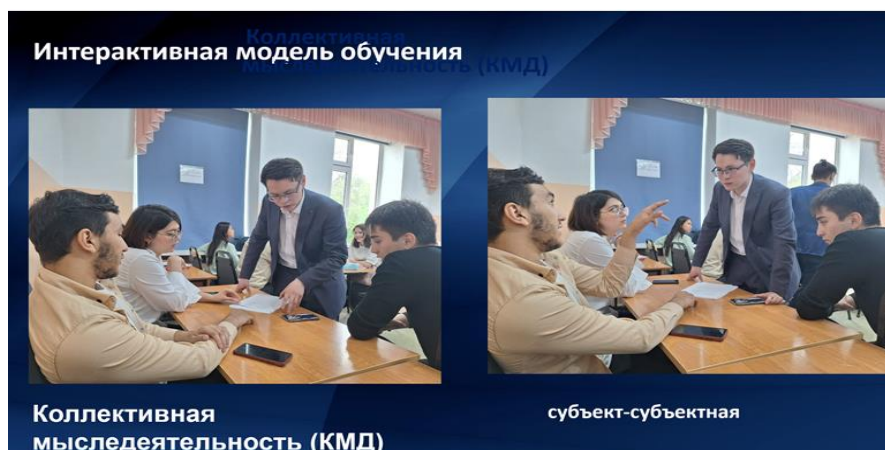
Фото 1 - Момент интеракции

формируется способность человека взаимодействовать, находиться в режиме беседы, диалога с кем-либо; осуществляется коллективная мыследеятельность (см. фото 1).