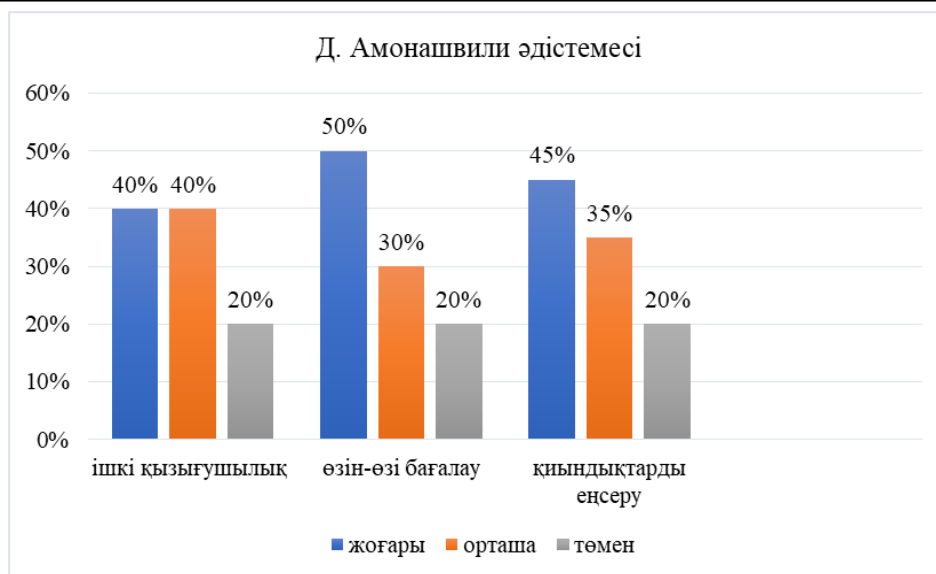
2-сурет. Д. Амонашвили шкаласы бойынша диагностика нәтижелері