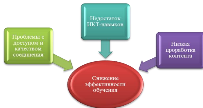
Диаграмма 1: Недостатки веб-квестов

Во-первых, доступ к интернету может быть ограничен или некачественным в некоторых регионах Казахстана. В подобных случаях использование веб-квестов становится затруднительным, а потеря доступа к сети интернет может полностью исключить студентов из процесса обучения.