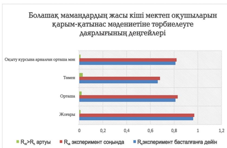
3-сурет. Эксперимент басталғанға дейін және кейін нәтижелерді салыстыру

Эксперимент басталғанға дейін және одан кейінгі нәтижелерді салыстыру эксперименттік жұмыс барысында болашақ мамандардың бастауыш сынып оқушыларының қарым-қатынас мәдениетін тәрбиелеуге даярлығының әртүрлі деңгейлері бар студенттер топтарының сандық құрамы бойынша ғана емес, сонымен қатар болашақ бастауыш сынып мұғалімінің жоғары, орта және төмен деңгейлер үшін бастауыш сынып оқушыларының қарым-қатынас мәдениетін тәрбиелеуге дайындық коэффициенттерінің орташа мәндерінің өзгеруін көрсетеді (3-сурет).