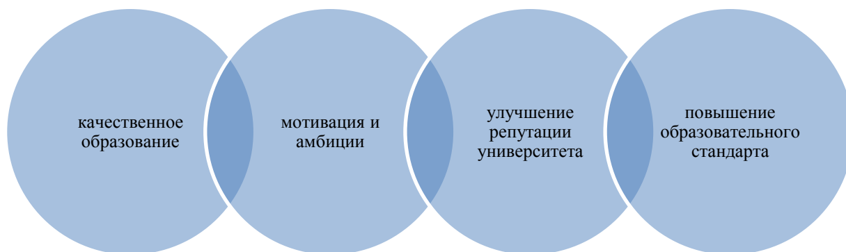
Рисунок-1 Преимущества программы Honors College в Нидерландах

– Качественное образование: Honors College обеспечивают студентам возможность получить более глубокие знания и навыки, что способствует их профессиональному и личностному росту.