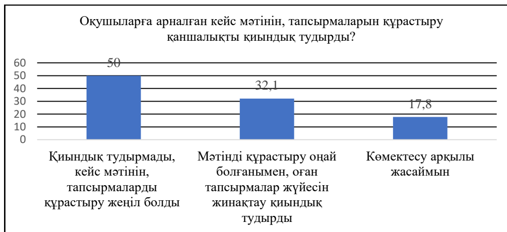
Сурет 2. Кейс мәтіні мен тапсырмаларды құрастырудағы қиындықтардың көрсеткіші

Келесідей «Оқушыларға арналған кейс мәтінін, тапсырмаларын құрастыру қаншалықты қиындық тудырды?» деген сауалға «қиындық тудырмады, кейс мәтінін, тапсырмаларды құрастыру жеңіл болды» деп 14 студент (50%) ойларын жеткізсе, 9 студент (32,1%) «мәтінді құрастыру оңай болғанымен, оған тапсырмалар жүйесін жинақтау қиындық тудырды» және 5 студент (17,8%) әлде де «қиналатындығын білдірді. Демек, инновациялық әдістер қатарындағы кейспен жұмыс жасау студенттерге жаңа ой тастап, қызығушылықтарын арттырса, сонымен қатар оны басқа да пәндер мазмұнына енгізу қажеттілігін, студенттердің әлі де болса оған жан-жақты дайындалу керектігін байқатады.