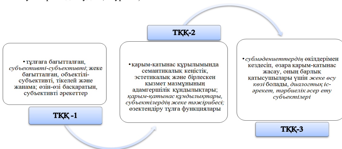
1-сурет. «Толерантты қарым-қатынас» түсінігінің топтастырылуы

Бізге зерттеу жұмыстарының нәтижесі көрсеткендей, «толерантты қарым-қатынасты» бірнеше қырынан тануға мүмкіндік туды. (1-суретте)