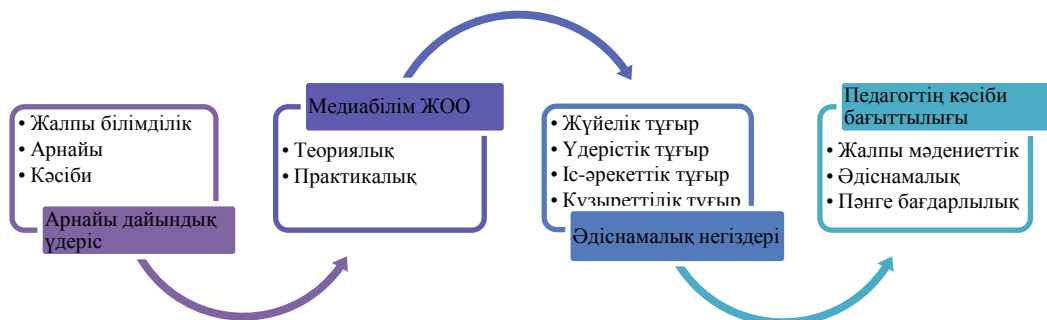
Сурет 3 - Болашақ әлеуметтік педагогтарды даярлаудың әдіснамалық тәсілдері

Медиабілім беру мен цифрлық технологияларды пайдаланудағы әлеуметтік және педагогикалық-психологиялық негізі анықталды, олар: