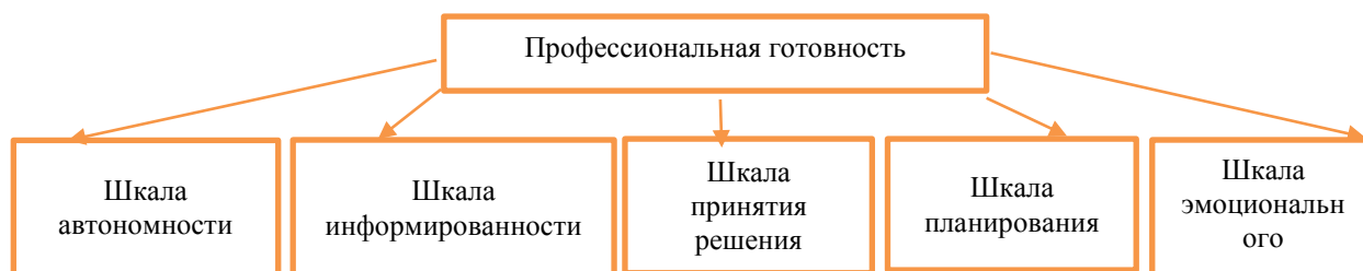
Рисунок 2 Шкалы опросника «Профессиональная готовность»

Данная методика будет применена в ходе эмпирического исследования с целью оценить уровень готовности подростков к принятию осознанного и адекватного профессионального выбора.