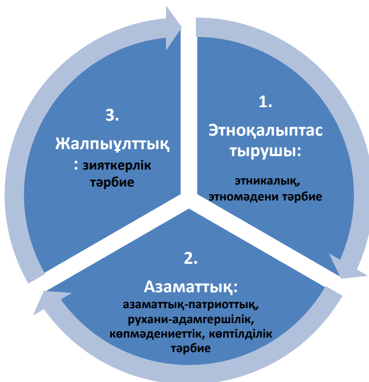
2-сурет. Қазақстанның оқушы жастарын ұлттық тәрбиелеудің жаңа Моделінің құрылымдық компоненттерінің мазмұны

3) жалпы ұлттық құрамдас бөлік шеңберінде ұлттық сана-сезімнің, патриотизмнің, азаматтықтың және әлеуметтік белсенділіктің даму деңгейі жоғары зияткерлік және бәсекеге қабілетті ұлтты қалыптастыруға бағытталған зияткерлік тәрбиеге басымдық беріледі.