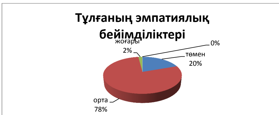
Сурет–2. Тұлғаның эмпатиялық бейімділіктері деңгейі.

Зерттеу жұмысының анықтау кезеңіндегі тұлғаның эмпатиялық бейімділіктері деңгейі анықтаудың диаграммалық көрсеткіштері берілген. Осы көрсеткіштердің нәтижесінде қалыптастырушы эксперимент жоспарланды. Ғылыми болжамның дәлелдігін эксперименттің қорытынды нәтижесі бойынша тұжырым жасалады.