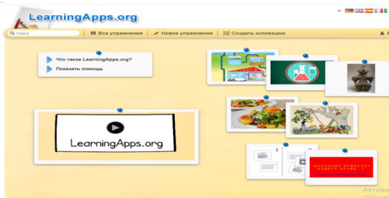
3 – сурет. «Learningapps.org» бағдарламасымен жұмыс жасау нұсқаулығы

«Learningapps.org» бағдарламасымен дайындалған цифрлық контенттердегі балалар әдебиеті материалдарын сабақта пайдалану оқушының көптеген жеке қасиеттерін, мысалы, жинақылық, шыдамдылық, ұқыптылық, байқау, шығармашылық, парасаттылық, тәуелсіздік танымдық, сөздері мен іс-әрекеттері үшін жауапкершілік, коммуникативтілік және т.б. оқыту мен тәрбиелеудің мотивациясын арттыруға (қалыптастыруға), танымдық қабілетінің жоғарылауында оң нәтиже беретіні белгілі. Сондай-ақ, түсіндірілген материалдар негізінде сұрақтар қою арқылы баланың тақырыпқа сай түрлі ассоциацияны атау қажеттігі туындайды. Мысалы, ертегілерді, аңыздарды немесе заманауи әңгімелерді мазмұндауда достық, өзара түсіністік, қамқорлық, сенім, сыйластық, ал мәтін мазмұны арқылы әке-шешенің, ата-әженің немесе айналасындағылардың мейірімін сезінуі, жауапкершілік, еңбек, денсаулық т.б. Аталған категориялар белгілі бір мөлшерде танымдық тұрғыдан белсенді болудың құрам-дастары болып саналады.