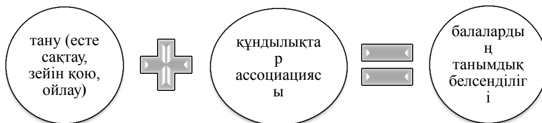
1–сурет. Танымдық белсенділіктің даму үдерісі

Балалар әдебиетіндегі жанрларда, яғни тақпақтар, ертегілер, аңыздар, жұмбақ, жаңылтпаштар, мақал-мәтелдер, қызықты оқиғалар және т.б. мазмұнды материалдар оқытылады. Алайда балалар әдебиетіндегі әрбір материал оқушылардың есте сақтауы, зейін қоюы, ойлануы арқылы материалдағы мазмұнды таниды, сөйтіп өзіне құндылықтарды қалыптастыра келе, өздігінен ассоциациялайды да нәтижесінде олардың танымдық белсенділігі ойлау арқылы дамып отырады. Бұның сипатын 1–суретте беріп отырмыз.