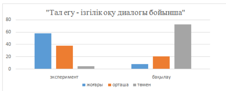
Сурет 2- «Тал егу - ізгілік» оқу диалогы арқылы әлеуметтік интеллектісі дамуын бақылау нәтижесі

Келесі диаграммада оқушылардың әлеуметтік интеллектісі дамуы көрсетіледі.