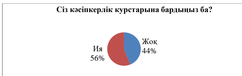
Сурет 2 – Кәсіпкерлік курсына қатысу

Сауалнама нәтижелерін талдау студенттердің «кәсіпкерлік құзіреттілік» және оның құрамдас бөліктері туралы ойларының шашыраңқы екені анықталды, бұл жоғарыда келтірілген көрсеткіштердің дәлелі. Алынған нәтижелер болашақ мұғалімдердің «кәсіпкерлік», «кәсіпкерлік құзіреттілік» ұғымдарының мәнін түсіну үшін көп еңбектенуі қажет екенін көрсетеді.