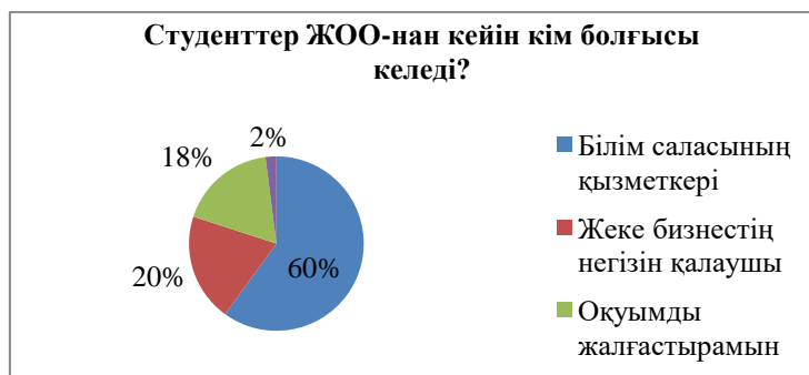
Сурет 3 – Студенттердің жоғары оқу бітіргеннен кейінгі жоспарлары

3-суретке сәйкес, сауалнамаға қатысқан оқушылардың негізгі бөлігі, атап айтқанда 60% бастауыш сынып мұғалімі болып жұмыс істеуді жоспарлайды, ал 20% жеке бизнестің басшысы немесе отбасылық кәсіптің мұрагері болғысы келеді. Сондықтан біз «Кәсіпкерлік негіздері» педагогикалық университеттегі ең маңызды пәндердің бірі бола алады және болуы керек деп есептейміз. Өйткені, болашақ мұғалім оқуын аяқтағаннан кейін өзінің білім беру орталығын құруды, өз аймағындағы сұранысқа ие балаларға арналған бағдарламаларды ашуға мүмкіндіктері болу керек деп есептейміз.