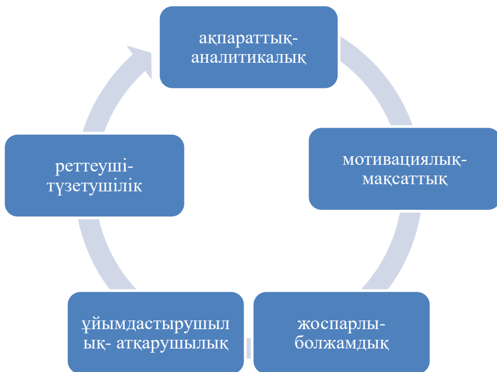
Сурет-3 Басқарудың қызметтері (Т.И. Шамова бойынша)

Суреттен байқағанымыздай, басқарудың бес қызметін атуға болады. Ақпараттық-аналитикалық, мотивациялық –мақсаттық, жоспарлы- болжамдық, реттеуші-түзетушілік, ұйымдастырушылық-атқарушылық.