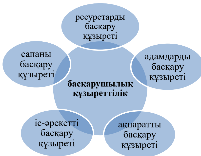
Сурет-4 Болашақ дене мәдениеті мұғалімінің басқарушылық құзыреттілігінің құрамындағы құзыреттер

Келесі кезекте біз болашақ дене мәдениеті мұғалімінің басқарушылық құзыреттілігін қалыптастырудың компоненттері мен көрсеткіштерін анықтауға тырыстық (кесте-1 )