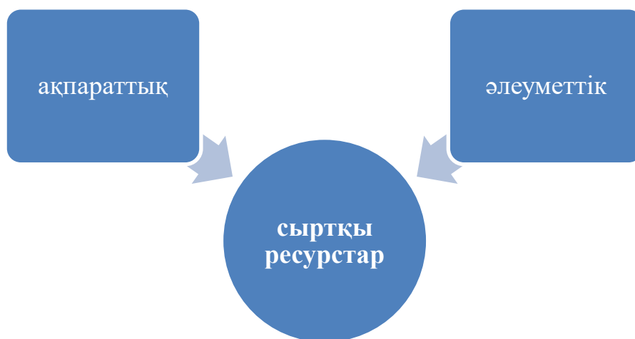
Сурет-2 Болашақ дене мәдениеті мұғалімінің құзыреттіліктерін қалыптастырудың сыртқы ресурстары

Құзыреттілікті қалыптастыру оқытудың мазмұнын да, психологиясын да өзгертуді талап етеді: - ішкі мотивация өзін-өзі дамыту көзі ретінде;