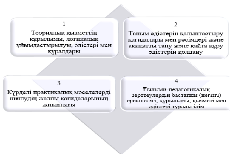
1 Сурет Әдіснама ұғымының топтастырылуы

Ғылыми зерттеулерде әдіснама ұғымының сипаты туралы түрлі тұжырымдаулар кездеседі. Біз, зерттеулерге сүйене отырып, келесідей топтастырып көрсетуге болады. Ендеше 1-суретте әдіснама ұғымының 4 топқа топтастырылуын ұсынамыз.